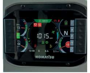
Çok fonksiyonlu 7 inç monitör