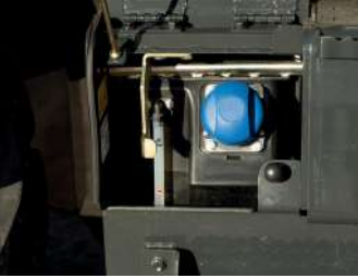
Zemin seviyesinden AdBlue®, yakıt ve hidrolik yağ dolumu

Bu seçenekler arasında bireysel ihtiyaçlarınız ve operasyonlarınıza yönelik olarak tercih yapabilirsiniz. Bu program, toplam işletme maliyetlerinizi azaltmaya yönelik olarak tasarlanmıştır.