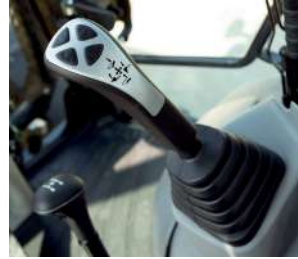
Kolay, ergonomik ve hassas kontrol

Yüksek çözünürlüklü 7 inç LCD monitörle mükemmel görüş hakimiyeti sağlanır. Yüksek çözünürlüklü LCD panel, görüş açısından ve çevre parlaklığından daha az etkilenir ve böylece mükemmel bir görüş kabiliyeti sağlar. Çeşitli uyarılar ve makina bilgileri basit bir format kullanılarak verilir. Çalışma kayıtları, makina ayarı ve bakım verileri gibi faydalı bilgiler de sağlanır. Operatör, hassas yan tuşlar aracılığıyla ekran sayfalarında kolayca gezinebilir.