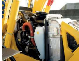
Günlük bakımı kolaylaştıran çift konumlu ön açıklık ve kolayca erişilebilen kontrol noktası