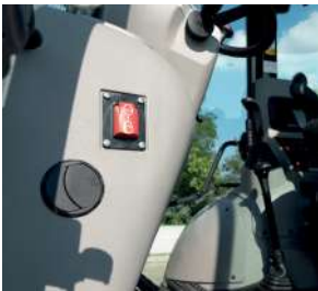
İkincil motor kapatma anahtarı

Komatsu WB97S-8'de yer alan güvenlik özellikleri, en son endüstri standartlarına uygundur hem makinanın içinde hem de çevresinde insanlara yönelik riskleri en aza indirmek için uyum içinde çalışır. Patlamaya dayanıklı valfler artık beko operasyonları için ve dengeleyicilerde de kullanılmaktadır.