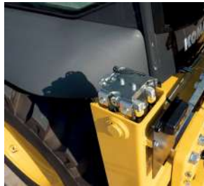
Dengeleyici, bom ve kol için patlamaya dayanıklı valfler (standart)

Yeni eklenen ve zemin seviyesinden erişilebilen ikincil bir "Motor kapatma" anahtarı ile yeni optik emniyet kemeri alarmı, Komatsu'nun alışlagelmiş operatör ortamı güvenliğini bir adım ileri taşımaktadır.