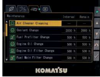
Monitör üzerinden bakım bilgilerine erişim imkanı