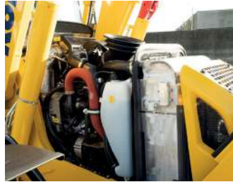
Günlük bakımı kolaylaştıran çift konumlu ön açıklık ve kolayca erişilebilir kontrol noktası