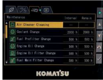
Monitör üzerinden bakım bilgilerine erişim imkanı