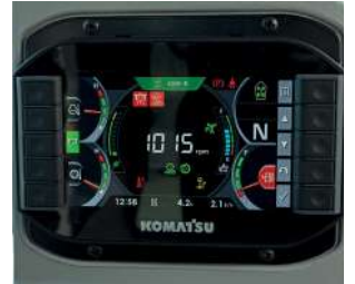
Çok fonksiyonlu 7 inç monitör